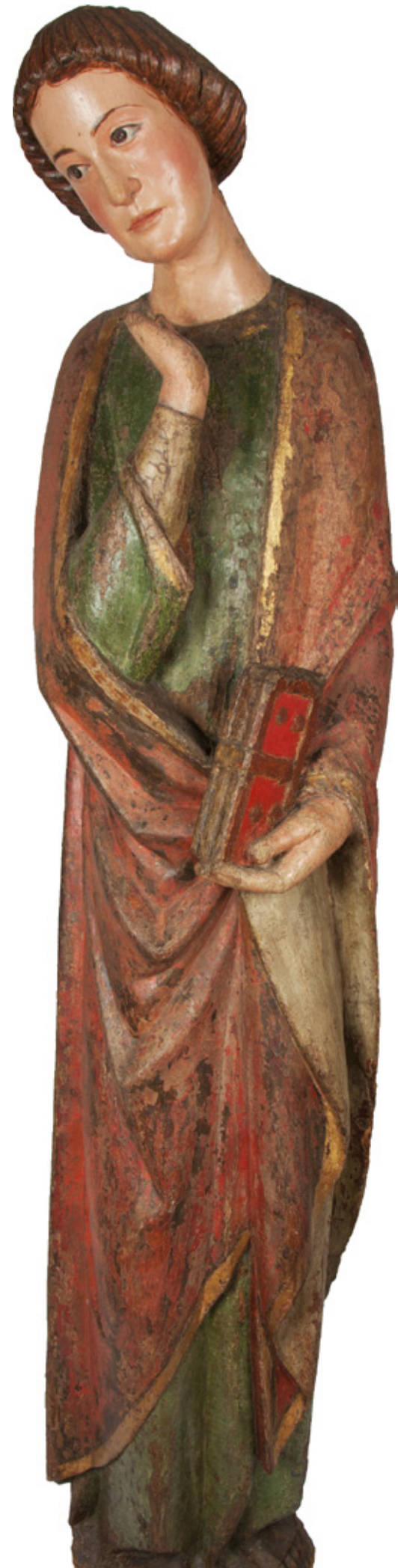
(derecha) San Juan Evangelista Madrid, Museo Sorolla